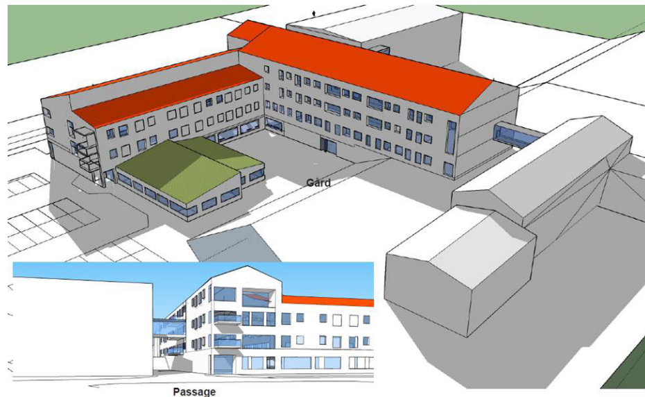
Kv Katedern Gamleby hälsocentral och bostäder skisser