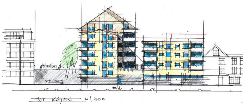
Kv Långholmen 3, Västervik skisser