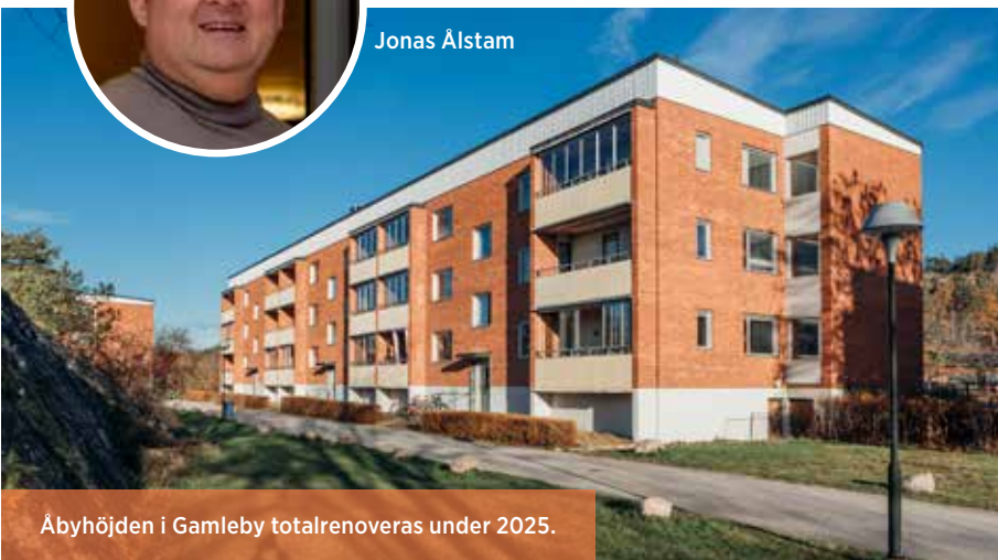
Åbyhöjden i Gamleby totalrenoveras under 2025.